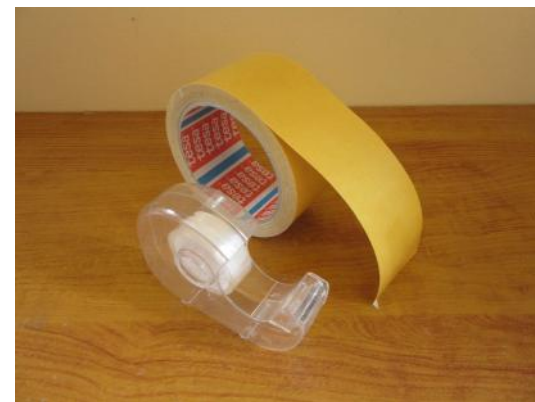
Scotch Nastro Biadesivo