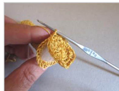
Unire l'Abaco alla Colonna lavorando a MBSS.