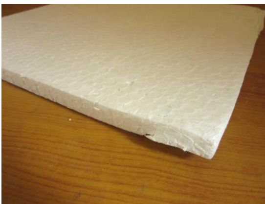
Polistirolo (spessore: 1 cm)