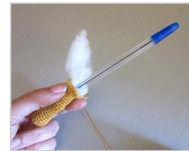
Con l'aiuto della penna inserire l'ovatta all'interno della colonna.