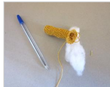
Munirsi di ovatta e penna.