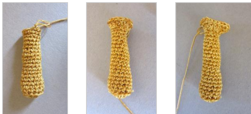
Fasi di lavorazione della Colonna.

Tagliare e nascondere il filo all'interno.