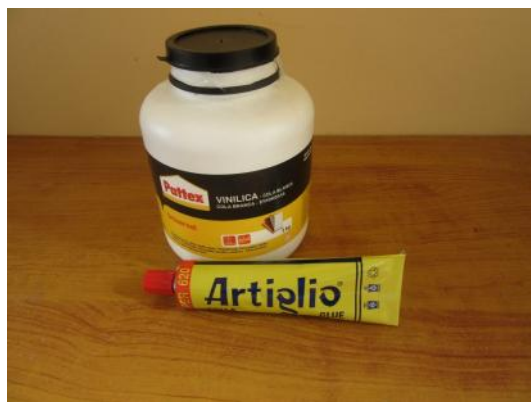
Colla Vinilica Colla Mastice