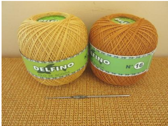
Cotone n.16 (Oro Chiaro, Oro Scuro) Uncinetto 1.75 mm