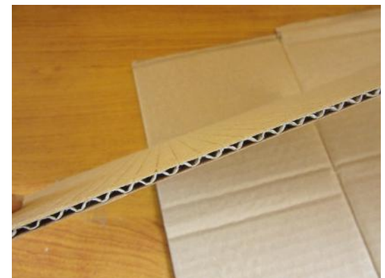
Cartone Fustellato (spessore: 4 mm)